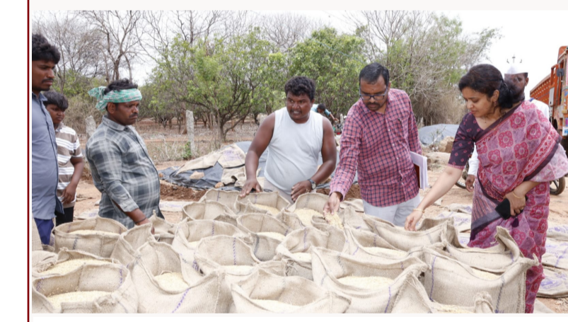
నారాయణపేట/ మద్దూర్, మే 27 (నిజాయితీ):

జిల్లాలోని కొనుగోలు కేంద్రాలలో ఉన్న ధాన్యం బస్తాలను వెంటనే లాలీల్లో లోడ్ చేయించి మిల్లులకు తరలించాలని జిల్లా కలెక్టర్ సీ. హెచ్. ప్రియాంక ఆదేశించారు. అ బుధవారం కలెక్టర్ మద్దూరు మండలం దమ్మగూడ గ్రామంలో గల వరి కొనుగోలు కేంద్రాన్ని తనిఖీ చేశారు బుధవారం తెల్లవారుజామున కురిసిన వర్షానికి కేంద్రంలోని ధాన్యం తడిసి పోయిందా అని ఆమె ఆక్రమి నిర్వహకులను అడిగి తెలుసుకున్నారు