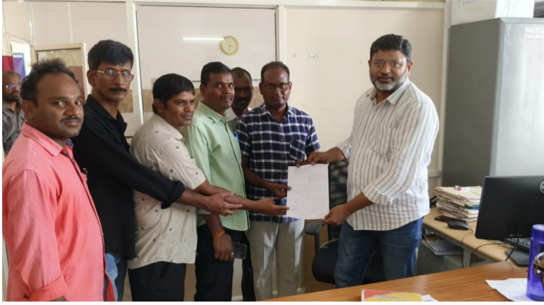
నాగర్ కర్నూల్, మే 27 (నిజాయితీ):