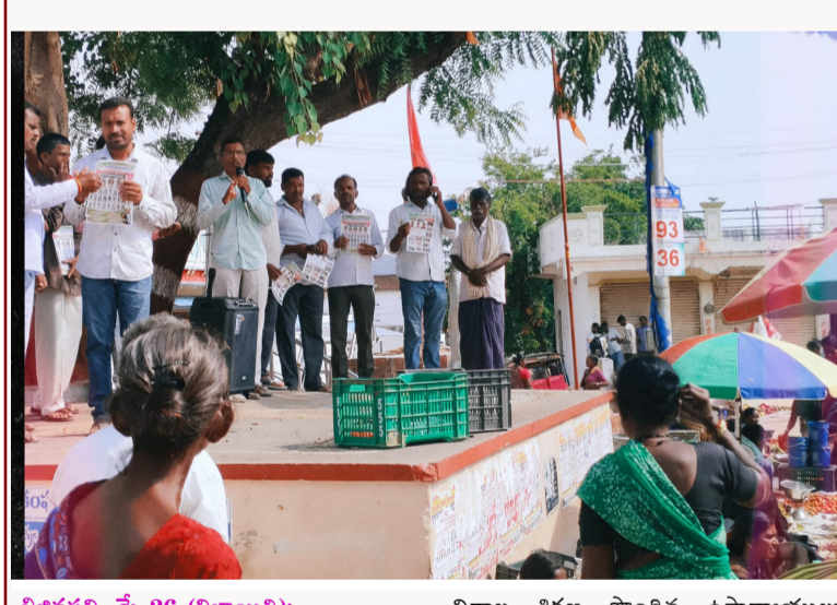
విజినపల్లి, మే 26 (నిజాయితీ):

బడిబాట కార్యక్రమంలో భాగంగానంది వడ్డేమాన్ గ్రామంలో మంగళవారం నాడు బడిబాట కార్యక్రమాన్ని జిల్లా పరిషత్ పాఠశాల ఉపాధ్యాయులు, విద్యార్థులు కలిసి నిర్వహించారు. మంగళవారం గ్రామ సంత ఉన్నందున అక్కడికి వెళ్లి రచ్చ కట్ట వేదికగా ప్రభుత్వ పాఠశాల లలో కల్పిస్తున్నట్లువంటి వసతులు సౌకర్యాలను గ్రామస్థులకు వివరించి సరిద్దీలో కనీస వేతనం 16000 నిర్ణయించి ఐస్ కిల్డ్ కార్మికునికి 20000 రూపాయలు పెంచి అమలు చేస్తున్నమని చెప్పుకోవడం సిగ్గుచేటు అన్నారు. పెరుగుతున్న ధరలకు అనుగుణంగా కార్మికులకు కనీస వేతనం 26 వేల రూపాయలు అమలు చేయాలన్నారు. విధి నిర్వహణలో మరణించిన కార్మికుల అంత్యక్రియల ఖర్చుల కోసం రూ.30 వేల ఆర్థిక సహాయం అందించాలని, అలాగే మృతి చెందిన కార్మికుల కుటుంబ సభ్యులకు ఉద్యోగవశానం కల్పించాలి. అదేవిధంగా కాంట్రాక్ట్ టెండ్ సోర్సింగ్ కార్మికులకు 15 క్యాబువల్