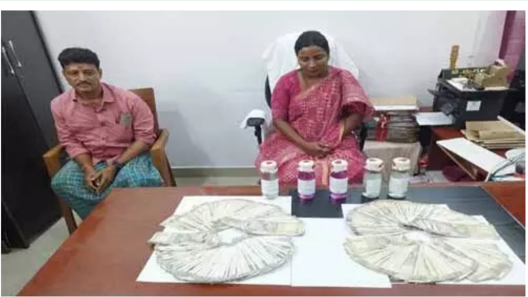
శామీర్ పేట, మే 26 (నిజాయితీ):