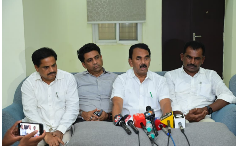
నాగర్ కర్నూల్, మే 26 (నిజాయితీ):