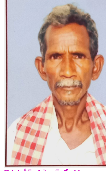
కొమరంబీమ్ అసిఫాబాద్, మే 26 (నిజాయితీ):

కొమరం బీమ్ అసిఫాబాద్లో పెంచికల్ పేట్ మండలం పరిధిలోని కమ్మర్లం జిబ్ లోని