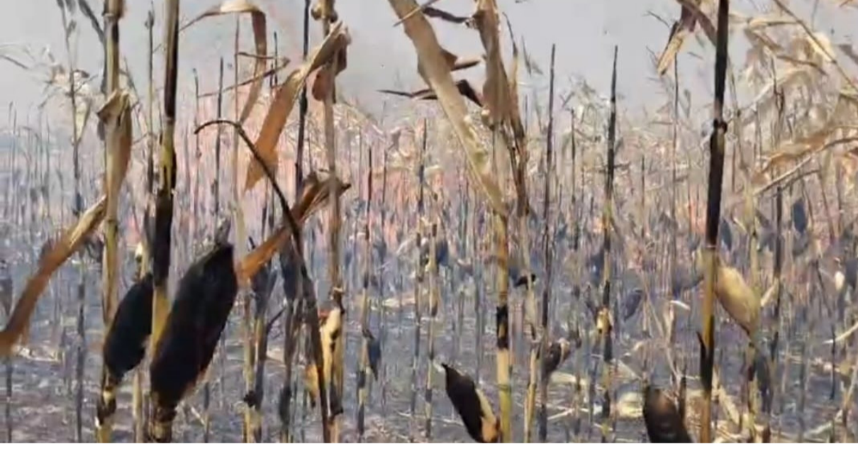
తెల్లపల్లి, మే 26 (నిజాయితీ):