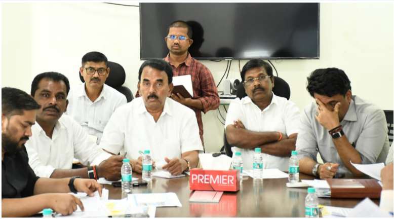
నాగర్ కర్నూల్, మే 26 (నిజాయితీ):