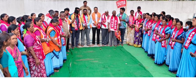
నాగర్ కర్నూల్, మే 26 (నిజాయితీ):