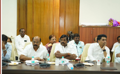
హైదరాబాద్, మే 25 (నిజాయితీ):