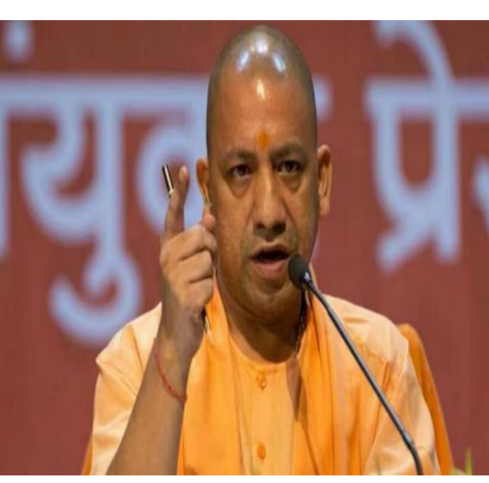
పరిశుభ్రతకు ప్రాధాన్యమివ్వాలని, సరైన పారిశుధ్య ఏర్పాటు చేయాలని అధికారులను ఆదేశించింది. బక్రీద్ సందర్భంగా ఎలాంటి అవాంఛనీయ ఘటనలు చోటుచేసుకోకుండా పోలీసు శాఖను అప్రమత్తం చేశారు సీఎం యోగి. రాష్ట్రంలోని సున్నిత ప్రాంతాలు, ఈద్గాహులు, మసీదుల వద్ద అదనపు భద్రతా బలగాలను మోహరించాలని ఆదేశించారు. సీసీటీవీ కెమెరాలు, డ్రాఫ్ట్ ద్వారా పర్యవేక్షణ చేపట్టాలని సూచించారు. అల్లర్లకు ప్రేరేపించే వ్యక్తులపై నిఘా ఉంచాలని పేర్కొన్నారు.

లఖ్ నహ్ : దేశవ్యాప్తంగా బక్రీద్(ఈడీ అల్ అధా) వేడుకలకు సన్నాహాలు జరుగుతున్న వేళ ఉత్తర్ ప్రదేశ్ ప్రభుత్వం అప్రమత్తమైంది. రాష్ట్రం లో శాంతిభద్రతలను కాపాడేందుకు సీఎం యోగి ఆదిత్యనాథ్ కీలక ఆదేశాలు జారీ చేశారు. బక్రీద్ సందర్భంగా బహిరంగ ప్రదేశా ల్లో నమాజ్ నిర్వహణ, జంతుబలి అనుమతి నిర్వహణ, సభాసభలు నిర్వహించిన ఉన్నతస్థాయి సమీక్షా సమావేశంలో జిల్లా కలెక్టర్లు, పోలీస్ ఉన్నతాధికారులకు సీఎం యోగి వల సూచనలు చేశారు. ప్రార్థనలు కేవలం మసీదు లు, ఈద్గాహుల పరిధిలోనే జరగాలని.. రోడ్లు, ఇతర బహిరంగ ప్రదేశాల్లో అనుమతి ఉండదని తెలిపారు. ఒకవేళ అధిక సంఖ్యలో భక్తులు హాజరయ్యే పరిస్థితి ఉంటే పిచ్చిల్లో సమాజ్ నిర్వహించాలని సూచించారు. అలాగే.. జంతుబలి విషయంలోనూ కఠిన నిబంధనలు అమలు చేయాలని యోగి సర్కార్ నిర్ణయించింది. బహిరంగ ప్రదేశాల్లో కుర్బానీ పూర్తిగా నిషేధమని, ప్రభుత్వం నిషేధించిన జంతుబలి ను బలిస్తే కఠిన చర్యలు తప్పవని హెచ్చరించింది. కుర్బానీ అనంతరం కూడా