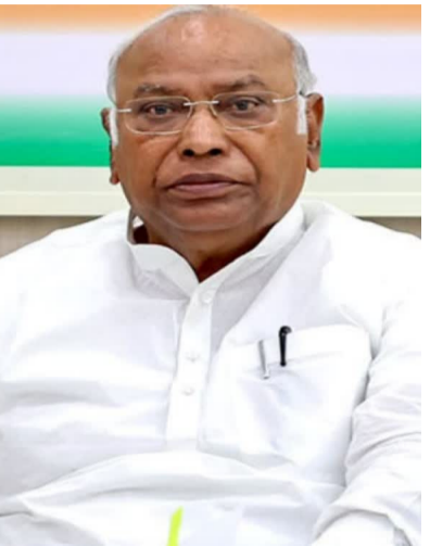
ఖర్గే ఎక్స్లో పోస్ట్ చేశారు. 2004, 2014 మధ్య యూపీఏ ప్రభుత్వ హయాంలో అంతర్జాతీయ చమురు ధరలు 175.34 శాతం పెరిగాయని ఖర్గే వెల్లడించారు. అదే మోదీ ప్రభుత్వ హయాంలో అంతర్జాతీయ చమురు

ధరలు, ఒక్క సెంట్ కూడా పెరగలేదన్నారు. అయినప్పటికీ మోదీ ప్రభుత్వం 2014లో లీటరుకు 71.41 రూపాయలుగా ఉన్న పెట్రోల్ ధరను 2026 నాటికి 102.12 రూపాయలకు పెంచినట్లున్నారు. అలా మొత్తంగా 43.01 శాతం పెంచినట్లున్నారు. 67.87 శాతానికి పెరుగుదల జరిగి ధరలను లీటరుకు 56.71 నుంచి 95.20 రూపాయలకు పెంచిన ఖర్గే విమర్శించారు. ఇది 67.87 శాతం పెరుగుదల అని ఖర్గే చెప్పారు. మోదీ ప్రభుత్వం గత 12 ఏళ్లలో ప్రజల నుంచి 43 లక్షల కోట్లను లూటీ చేసిందని ఆయన దుయ్యబట్టారు. అంటే రోజూ 1,000 కోట్ల రూపాయలు చౌప్పిన దోపిడీ చేసిందని ఆరోపించారు. ప్రజల కంటే లాభాల ఉందని విమర్శించారు. ప్రతి ఇంధన ధరల పెంపు గృహ బడ్జెట్ పై మరో దెబ్బ లాంటిదని పేర్కొన్నారు. ఇది ఆర్థిక వ్యవస్థలోని ప్రతి రంగంపై తీవ్ర ప్రభావం చూపుతుందని ఆందోళన వ్యక్తం చేశారు. రైతుల నుంచి ఎంపిఎంకల వరకు సమాజంలోని ప్రతి వర్గం బీజేపీ దోపిడీ వల్ల సష్టపోతోందని ఖర్గే పేర్కొన్నారు.