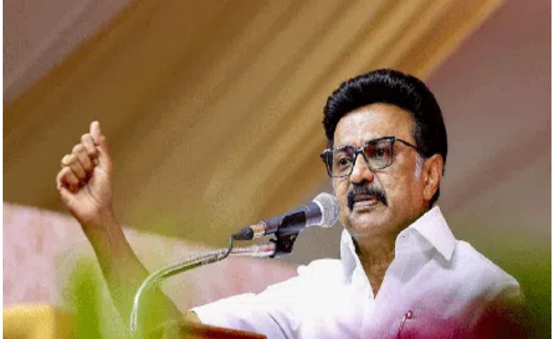
జన్మస్థానించారు. తల్లిని పిల్లలు వెతికినట్లు మధ్యం కొద్దిరోజుల్లో డీఎంకేను వెతుక్కుంటూ వస్తారని తాజాభావం వ్యక్తం చేశారు. దీనికి కొద్ది రోజులు ముందు కూడా విజయ్ ప్రభుత్వం

చెన్నై: జోసెఫ్ విజయ్ నాయకత్వంలో తమిళనాడు వెలి కళగం (టీవీకే) ప్రభుత్వ ముగడంపై మాజీ ముఖ్యమంత్రి, డీఎంకే అధినేత ఎంకే స్టాలిన్ మరోసారి సంవలన వ్యాఖ్యలు చేశారు. డీవీకే సర్కారు రెండేళ్లు కూడా కొనసాగదని స్టాలిన్ జోస్యం చెప్పారు. జరిగిన డీఎంకే యువజన విభాగం నిర్వాహకుల సమావేశంలో స్టాలిన్ పాల్గొన్నారు. ఈ సందర్భంగా ఆయన మాట్లాడుతూ... ప్రస్తుత పరిస్థితులకు అనుగుణంగా యువజన విభాగం సోషల్ మీడియాలో మరుకుగా ఉండాలని సూచించారు. పార్టీ సిద్ధాంతాలను సామాజిక మార్గదర్శిగా విస్తృతంగా ప్రచారం చేయాలని స్టాలిన్ పిలుపునిచ్చారు. సొంతంగా కంటెంట్ క్రియేట్ చేసేలా యూత్ వింగ్ వర్క్ షాపులను నిర్వహించాలని ఉదయనిధి స్టాలిన్ కు డీఎంకే అధినేత సలహా ఇచ్చారు. సీని గ్లూమర్ వల్లే డీవీకే డీవీకే గెలిచిందని, ఇది రాజకీయ చైతన్యం ఏ మార్పుకొందని అన్నారు. ఈ ఆకర్షణ తాజాభావం వ్యక్తం చేశారు. దీనికి కొద్ది రోజులు ముందు కూడా విజయ్ ప్రభుత్వం