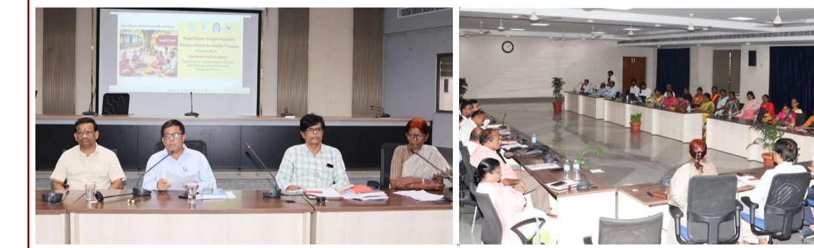
గద్వాల, మే 25 (నిజాయితీ):