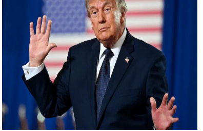
తలోగిందని సమాచారం. దీంతో రెండు దేశాల మధ్య ఒక ఒప్పందం కుదిరే అవకాశం ఉన్నట్లు తెలుస్తోంది. అయితే, ఇలాంటి తరుణంలో బ్రుంక్ చేసిన పోస్ట్ ఆసక్తికరంగా మారింది. అంతకుముందు కూడా బ్రుంక్ తన సోషల్ మీడియా బ్రాంక్ ద్వారా ఇరాన్ తో చర్చలు అంతంపై స్పందించారు. ఇరాన్ తో చర్చలు, ఒప్పందం విషయంలో తామేమీ తొందరపడటం లేదన్నారు.

అమెరికా: ఇరాన్, అమెరికా మధ్య శాంతి చర్చలు జరుగుతున్న సంగతి తెలిసిందే. అయితే, ఈ విషయంలో ఒక స్పష్టత రావడం లేదు. ఈ నేపథ్యంలోనే తాజాగా బ్రుంక్ తన సోషల్ మీడియాలో చేసిన ఒక పోస్ట్ సంవలనంగా మారింది. భాంబును మోసుకెళ్తున్న ఒక యుద్ధ విమానం ఫోటోను షేర్ చేశారు బ్రుంక్. ఆ ఫోటోపై 'థాంక్యూ ఫర్ యువర్ అటెన్షన్' టు దిస్ మ్యాటర్' అని రాసి ఉంది. యుద్ధ విమానం, ఒక మిస్సైల్ ఫోటో షేర్ చేశాడంటే మళ్లీ ఇరాన్ పై దాడికి అమెరికా సిద్ధమవుతోందా అనే సందేహాలను వ్యక్తం చేస్తున్నాయి. ఒక వక్ర ఇరాన్ తో అమెరికా చర్చలు కీలక దశలో ఉన్నట్లు ప్రచారం జరుగుతోంది. త్వరలోనే ఇరు దేశాల మధ్య ఒక ఒప్పందం కుదిరే అవకాశం ఉన్నట్లు తెలుస్తోంది. ఇరాన్ డిమాండ్లను అమెరికా అంగీకరించినందు, అమెరికా డిమాండ్లకు కూడా ఇరాన్