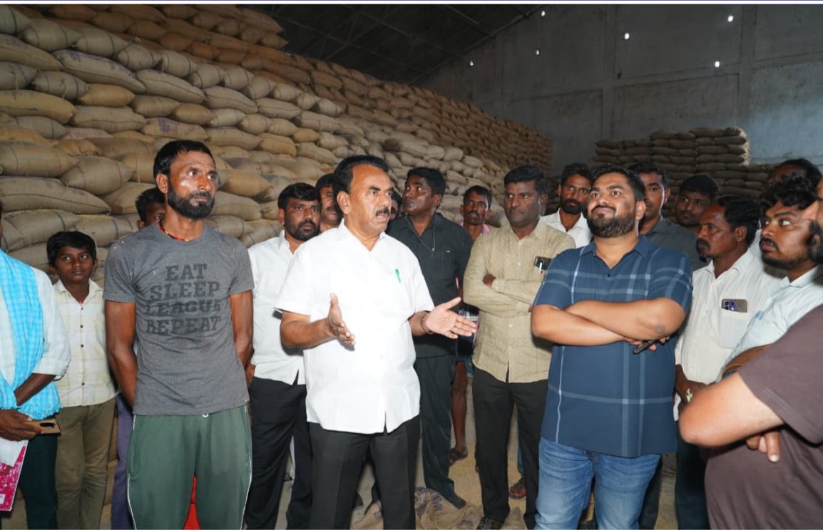
నాగర్ కర్నూల్, మే 25 (నిజాయితీ):