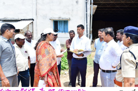
మహబూబ్ నగర్, మే 25 (నిజాయితీ):