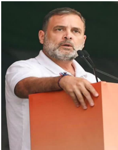
సమయంలో ప్రధానమంత్రి ఎన్నికల ప్రచారంపైనే దృష్టి సారించారని ఆయన ఆరోపించారు. ఇంధన దోపిడీ ఇంకా ముగియ లేదు ఇంధన దోపిడీ రోజువారీ దాడి ఇంకా ముగియలేదని కాంగ్రెస్ అధ్యక్షుడు మల్లికార్జున

న్యూ ఢిల్లీ: ఇంధన ధరల పెంపుపై కాంగ్రెస్ మండిపడింది. ఈ రోజువారీ దోపిడీ వల్ల ఎవరు లబ్ధి పొందు తున్నారని ప్రశ్నించింది. సామాన్య ప్రజల పొరు పును తగలబెట్టడానికి, మోదీ ప్రభుత్వం పెట్రోల్ లో చల్లదనని విమర్శించింది. గత 10 రోజుల్లో ఇంధన ధరలను పెంచడం ఇది నాలుగోసారిని ఆగ్రహం వ్యక్తం చేసింది. దేశాన్ని దోచుకునే వల్ల రైతులు, చిన్న పరిశ్రమలు, సమాజంలోని ప్రతి వర్గం సష్టపోతున్నారని ఆరోపించింది. 'ద్రవోల్బణ మనిషి మోదీ': రాహుల్ ప్రభుత్వం పౌరుల జేబులను "నిశ్శబ్దంగా దోచుకుంటోంది" కాంగ్రెస్ నాయకుడు రాహుల్ గాంధీ తన 'ఎక్స్' ఖాతాలో పోస్ట్ చేశారు. ఎన్నికల సమయంలో ఇంధన ధరలను అదుపులో ఉంచినప్పటికీ, ఇప్పుడు వాటిని విడతల వారీగా పెంచుతున్నారని, ఇకపై అవి మరింత పెరుగుతూనే ఉంటాయని ఆయన ఆరోపించారు. ప్రధానమంత్రి నరేంద్ర మోదీని ద్రవోల్బణ మనిషి మోదీ అని అభివర్ణిస్తూ, రానున్న 'అర్ధ శతాబ్దం' గురించి తాను గతంలోనే హెచ్చరించానని, అయితే ఆ