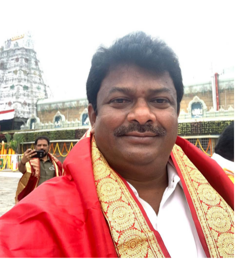
నాగర్ కర్నూల్, మే 25 (నిజాయితీ): నాగర్ కర్నూల్ జిల్లా కేంద్రంలోని వాసవీ