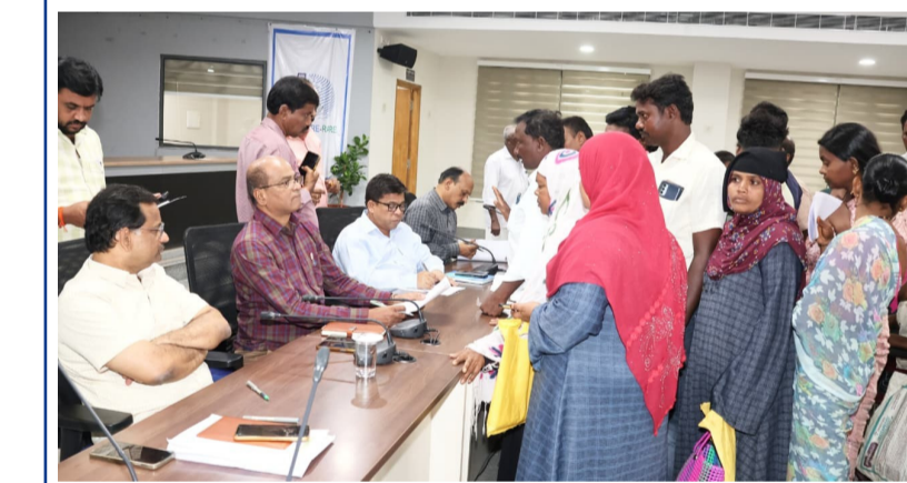
గద్వాల, మే 25 (నిజాయితీ):