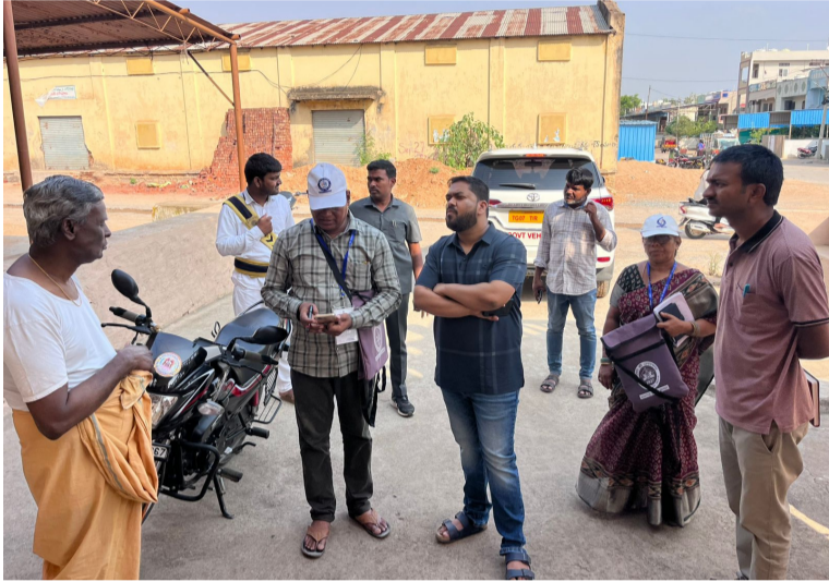
నాగర్ కర్నూల్, మే 25 (నిజాయితీ):