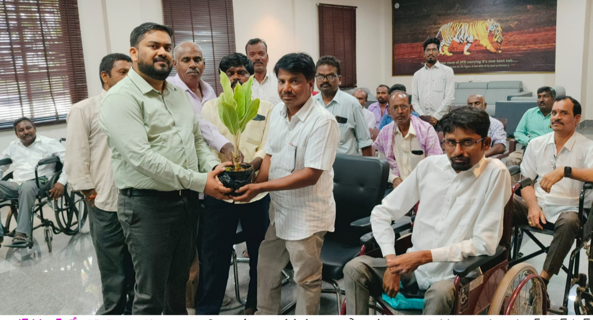
నాగర్ కర్నూల్, మే 25 (నిజాయితీ):