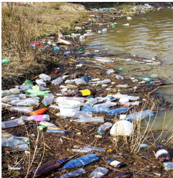
హైదరాబాద్, మే 13 (నిజాయితీ):

హైదరాబాద్ నగరం నడిబొడ్డున ఉన్న హుస్సేన్ సాగర్ ఒకప్పుడు తాగునీటి అవసరాలను తీర్చిన అద్భుతమైన జలాశయం. ఒకప్పుడు తాగునీటి మూలం, పర్యాటక ఆకర్షణ. కానీ నేడు అది నగర కాలుష్యానికి ప్రతీకగా మారింది. అది కుకట్లపల్లి నుంచి వచ్చే గ్రే వాటర్, జీడిమెట్ల నుంచి వచ్చే విషపూరిత ట్రాక్ వాటర్ కు నిలయంగా మారింది. వచ్చే గృహ మురుగు నీరు, పరిశ్రమల నుంచి వచ్చే రసాయన వ్యర్థాలు కలిసిపడి సరస్సును తీవ్రమైన ప్రమాద స్థితిలోకి నెట్టాయి. దశాబ్దాలుగా పాలకులు మారుతున్నా, వేల కోట్లు ఖర్చు చేస్తున్నా సరస్సు స్థితి మాత్రం మారలేదు. ఈ పరిస్థితి మేక కన్న పాలనాపరమైన లోపాలు, కమిషన్ కక్కుర్తి మరియు ప్రజా ధనం వృధా చేయడమే. ఈ సమస్య కేవలం పర్యావరణ సమస్య కాదుఇది పాలన, బాధ్యత, ప్రజా ధనం వినియోగంపై పద్ధ ప్రశ్నను లేవనెత్తుతోంది.