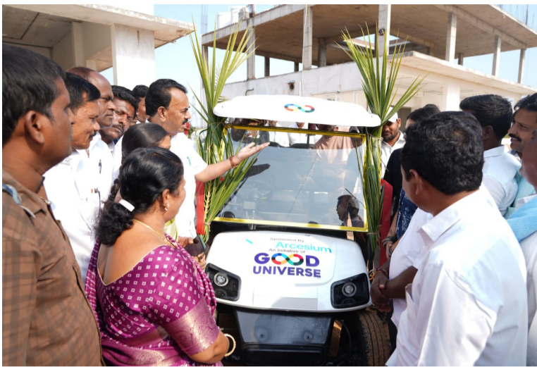
కొల్లాపూర్, మే 12 (నిజాయితీ):

కొల్లాపూర్ పట్టణంలోని మాతా శిశు సంరక్షణ ఆసుపత్రికి వచ్చే గర్భిణులు, బాలింతల రవాణా కష్టాలు తీరనున్నాయి. వారి సౌకర్యార్థం ఏర్పాటు చేసిన ఉచిత ఎలక్ట్రిక్ బ్యాటరీ వాహనాన్ని పర్యాటక, సాంస్కృతిక, ఎక్సైజ్ శాఖ మంత్రి జూపల్లి కృష్ణారావు మంగళవారం ప్రారంభించారు.