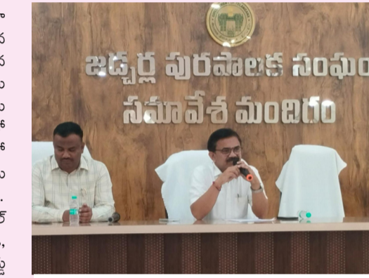
మున్సిపల్ సిబ్బందితో సమీక్ష సమావేశం నిర్వహిస్తున్న ప్రత్యేక అధికారి, మున్సిపల్ కమిషనర్