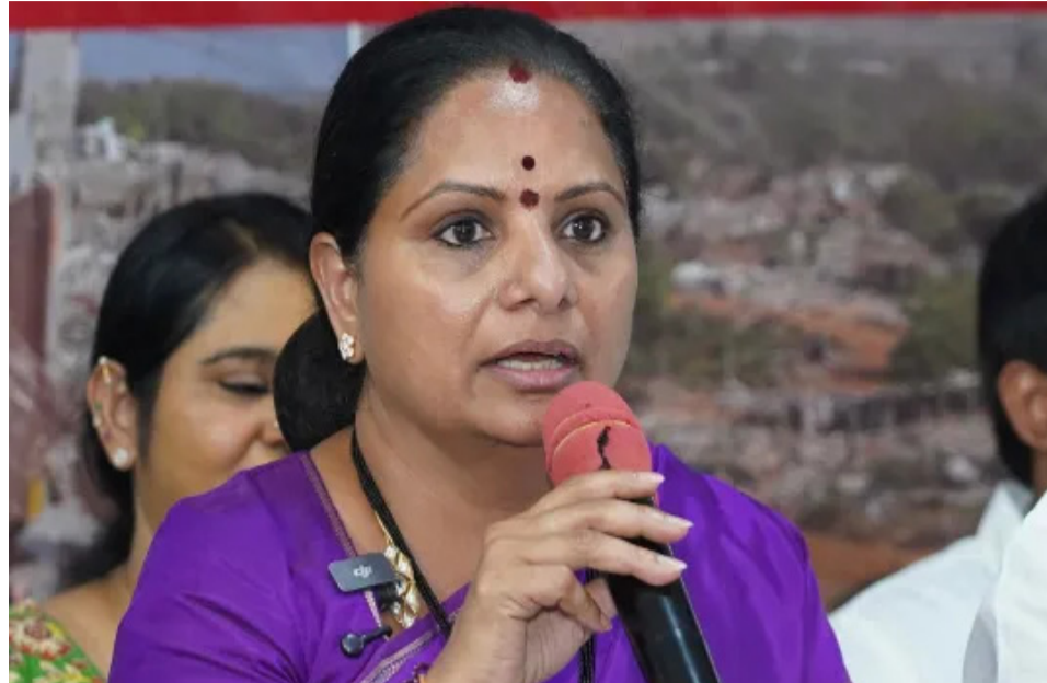
అత్యగ్రావం కోసం తెలంగాణ రక్షణ సేన పనిచేస్తుందని, రైతులకు మేలు చేసే విషయంలో సీరియస్ గా పని చేస్తామన్నారు.

వైద్యం విషయంలో కూడా పేద మధ్యతరగతి కుటుంబాలకు ఉచిత వైద్యాన్ని ఇవ్వడానికి తాము సంకల్పించాము అని అధికారంలోకి వస్తే చేసి చూపిస్తామన్నారు. తెలంగాణ రాష్ట్రంలో రైతన్న