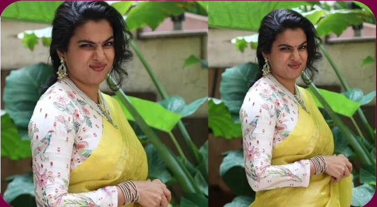
ప్రముఖ గాయని శ్రావణ భార్గవి తన సూతన స్వతంత్ర పాట ఫకుయామా విజయంతో పాటు వ్యక్తిగత, వృత్తిపరమైన మార్పులను ఓ ఇంటర్వ్యూలో పంచుకున్నారు. యూట్యూబ్లో పదకొండు నుంచి పన్నెండు లక్షల వ్యూస్ తో దూసుకుపోతున్న ఈ పాటను మహిళలందరికీ ఒక కానుక అని అన్నారు. ఫకుయామా తన ఆలోచనలు, అభిప్రాయాలు,