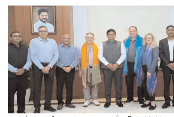
చెందుతోందని తెలిపారు. వైపుజ్ఞుల ఉన్న ఇంజనీరింగ్ మానవ వనరులు, పరిష్కారమైన డిజిటల్ మార్కెట్ వ్యవస్థ, పరిశ్రమలకు అనుకూలమైన విధానాలు, వేగంగా విస్తరిస్తున్న తయారీ రంగం, హైదరాబాద్ ను ప్రపంచ స్థాయి జిసిసిలకు అగ్రగామి గమ్యస్థానంగా తీర్చిదిద్దామని శ్రీధర్ బాబు

హైదరాబాద్: ఆధునాతన ఇంజనీరింగ్, డిజిటల్ తయారీ సంస్థ ప్రాటోల్యాబ్స్ టెక్నాలజీస్ హైదరాబాద్ లో ప్రపంచ స్థాయి గ్లోబల్ సామర్థ్య కేంద్రం (జిసిసి) ఏర్పాటుకు ముందుకొచ్చిందని ఐటీ, పరిశ్రమల మంత్రి దుద్దిళ్ల శ్రీధర్ బాబు వెల్లడించారు. దీని స్థాపనతో 300 మంది ప్రతిభావంతులకు ఉద్యోగావకాశాలు దొరుకుతాయని ఆయన తెలిపారు. అమెరికాలోని మిస్సోసోటా కేంద్రంగా కార్యకలాపాలు నిర్వహించే ప్రాటోల్యాబ్స్ స్థానిక ఆలోహన్ గ్లోబల్ కన్సల్టింగ్ తో కలిసి ఈ జిసిసిని నెలకొల్పినట్లు తెలిపారు. గురువారం ప్రాటోల్యాబ్స్ ప్రతినిధి బృందం సవివాలయంలో శ్రీధర్ బాబుతో భేటీ అయ్యింది. ఈ సందర్భంగా సంస్థ ప్రతినిధులు తమ విస్తరణ కార్యక్రమాలను వివరించారు. జిసిసి ఏర్పాటుకు హైదరాబాద్ ను ఎంపిక చేసుకోవడం పట్ల శ్రీధర్ బాబు హర్షం వ్యక్తం చేశారు.